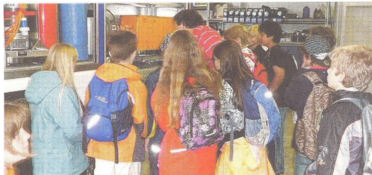
Auch Einblicke in die Arbeit des Technischen Hilfswerks in Füssen gewannen die Schüler.

kroskop das Moorleben entdecken. In Schwangau lernten die Realschüler das Innenleben der Tegelbergbahn kennen; die König-LudwigKlinik und das Thermalbad boten interessante Einblicke in ihre gesundheitsorientierten Angebote. Nesselwang präsentierte das Spielhaus im Feriendorf Reichenbach, auch gab es Messungen des Elektrosogs. Am Staudamm in Roßhaupten besuchten die Jugendlichen das neue Info-Center. Die Riedener besuchten die Fachklinik Enzensberg und das Biohotel Eggenberger. Gesundes Wohnen und Passivhäuser waren Thema bei der Firma Ambros in Hopferau. Und eine weitere Gruppe bekam nach ihrer Wanderung eine Führung durch H. Kösel im Sudhaus in Speiden.